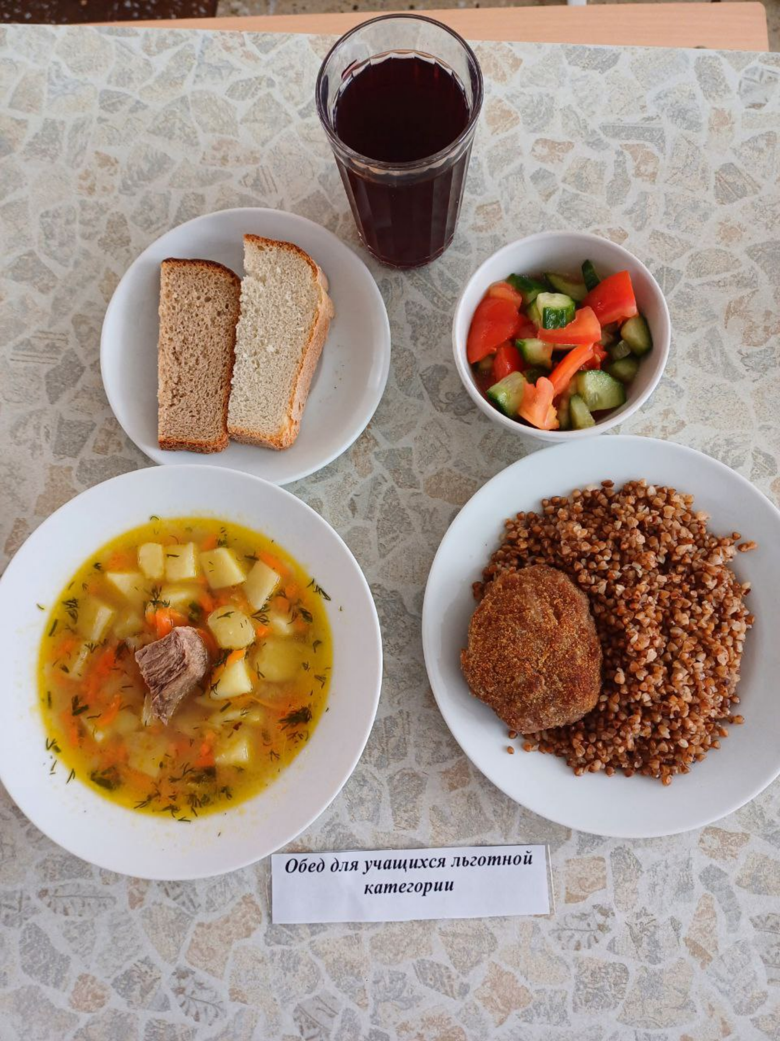
Обед для учащихся льготной категории