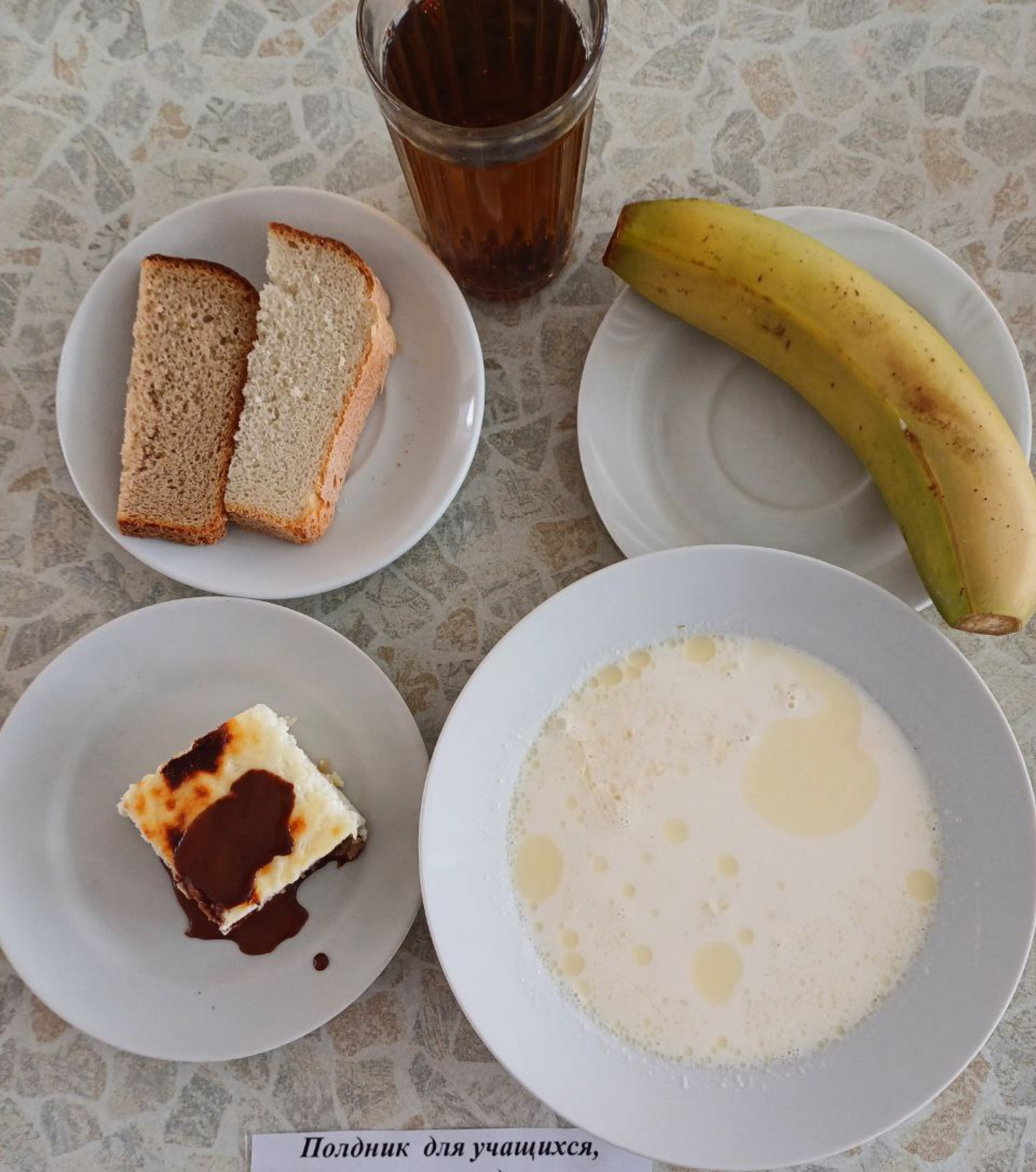
Полдник для учащихся, питающихся за родительскую плату 5-11 классы