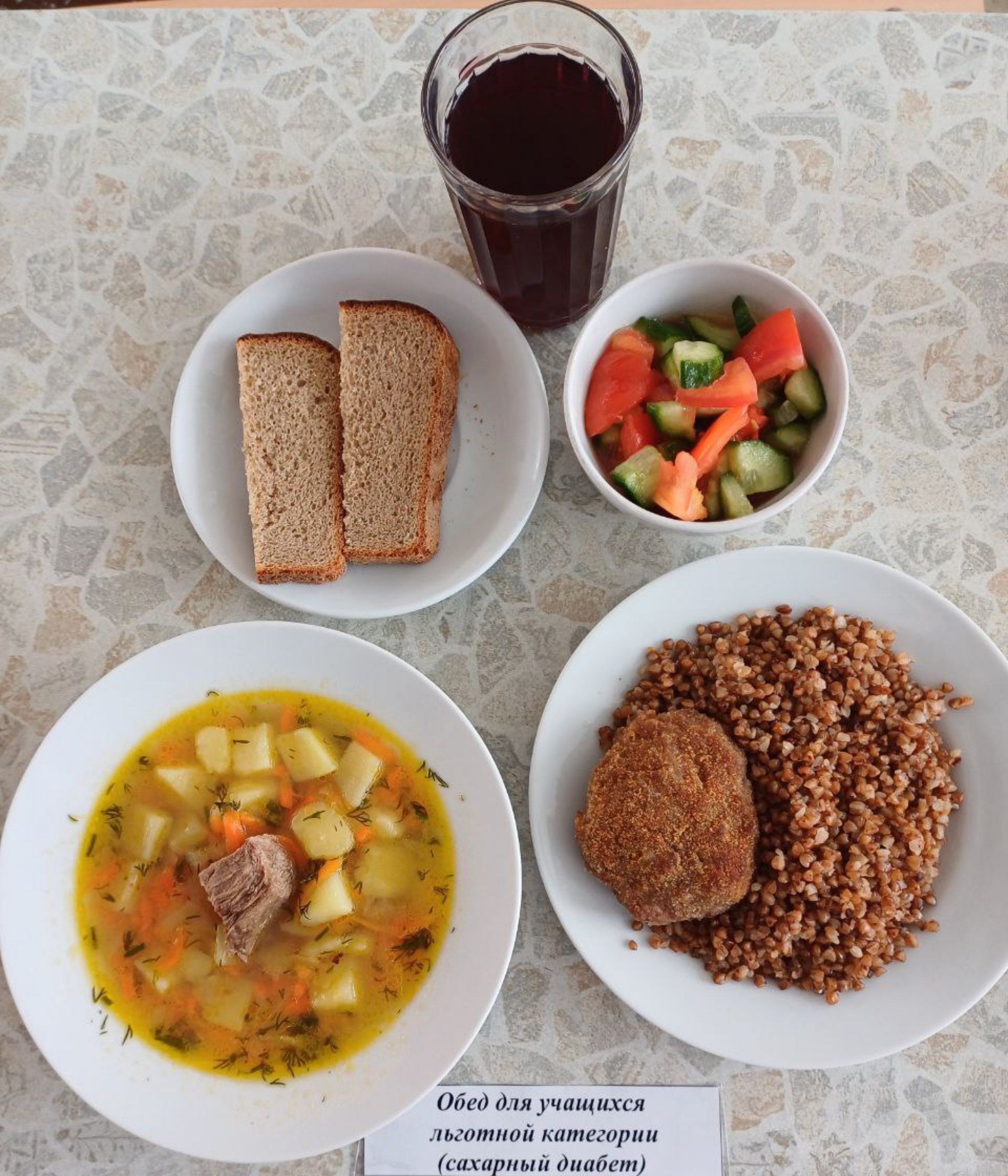
Обед для учащихся льготной категории (сахарный диабет)