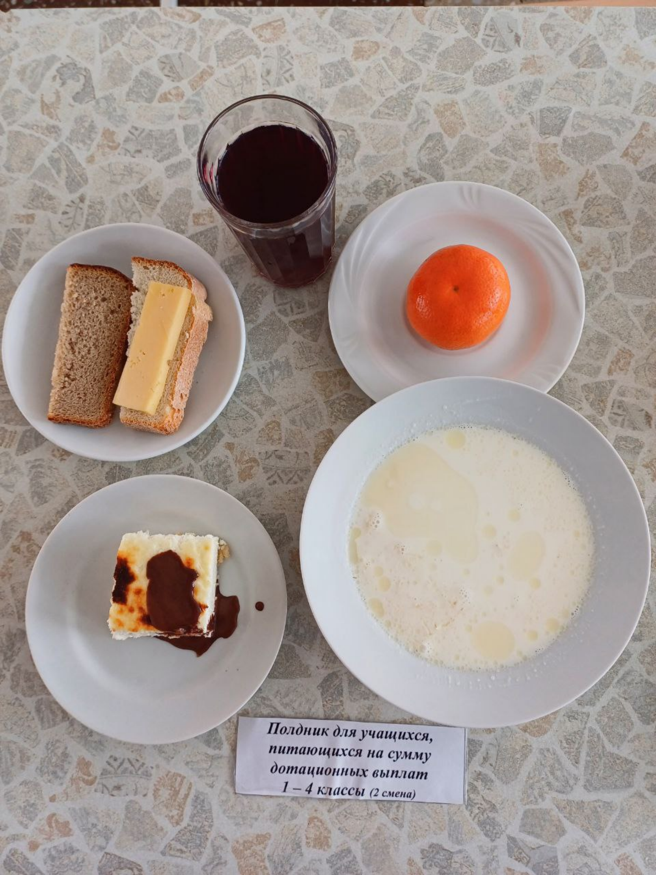
Полдник для учащихся, питающихся на сумму дотационных выплат 1 – 4 классы (2 смена)