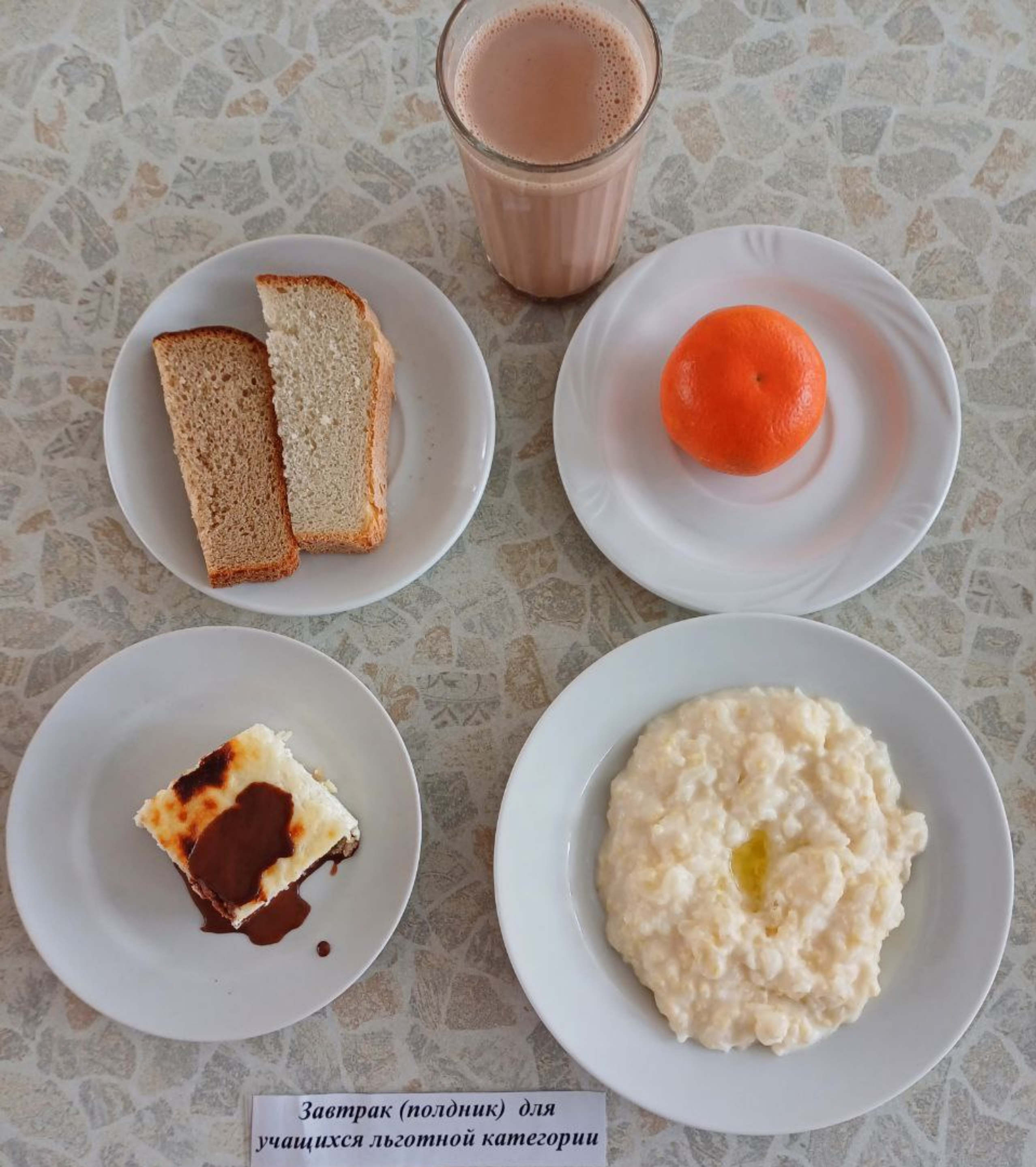
Завтрак (полдник) для учащихся льготной категории