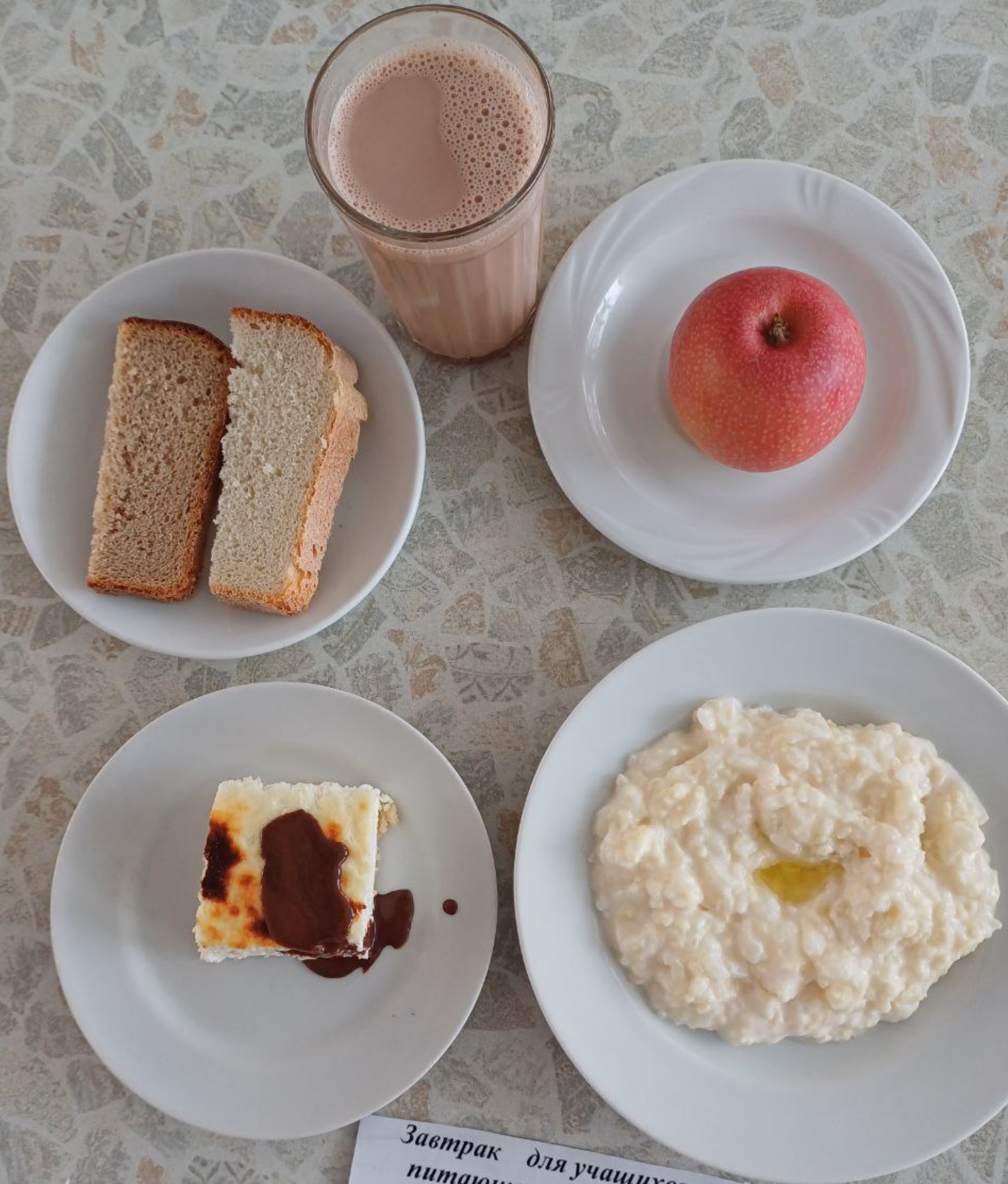
Завтрак для учащихся, питающихся на сумму дотационных выплат 1 – 4 классы (1 смена)