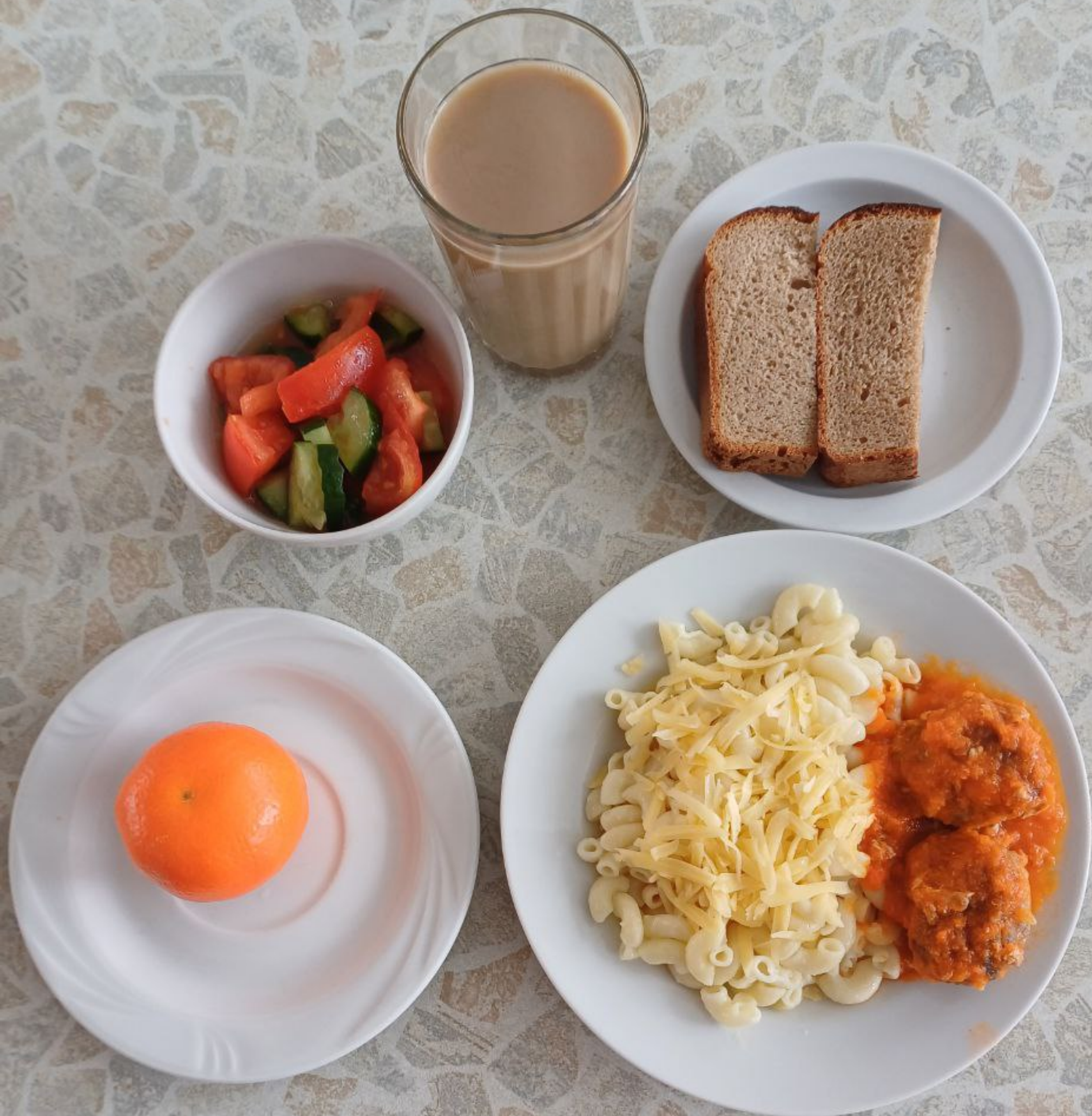
Завтрак (полдник) для учащихся льготной категории (сахарный диабет)