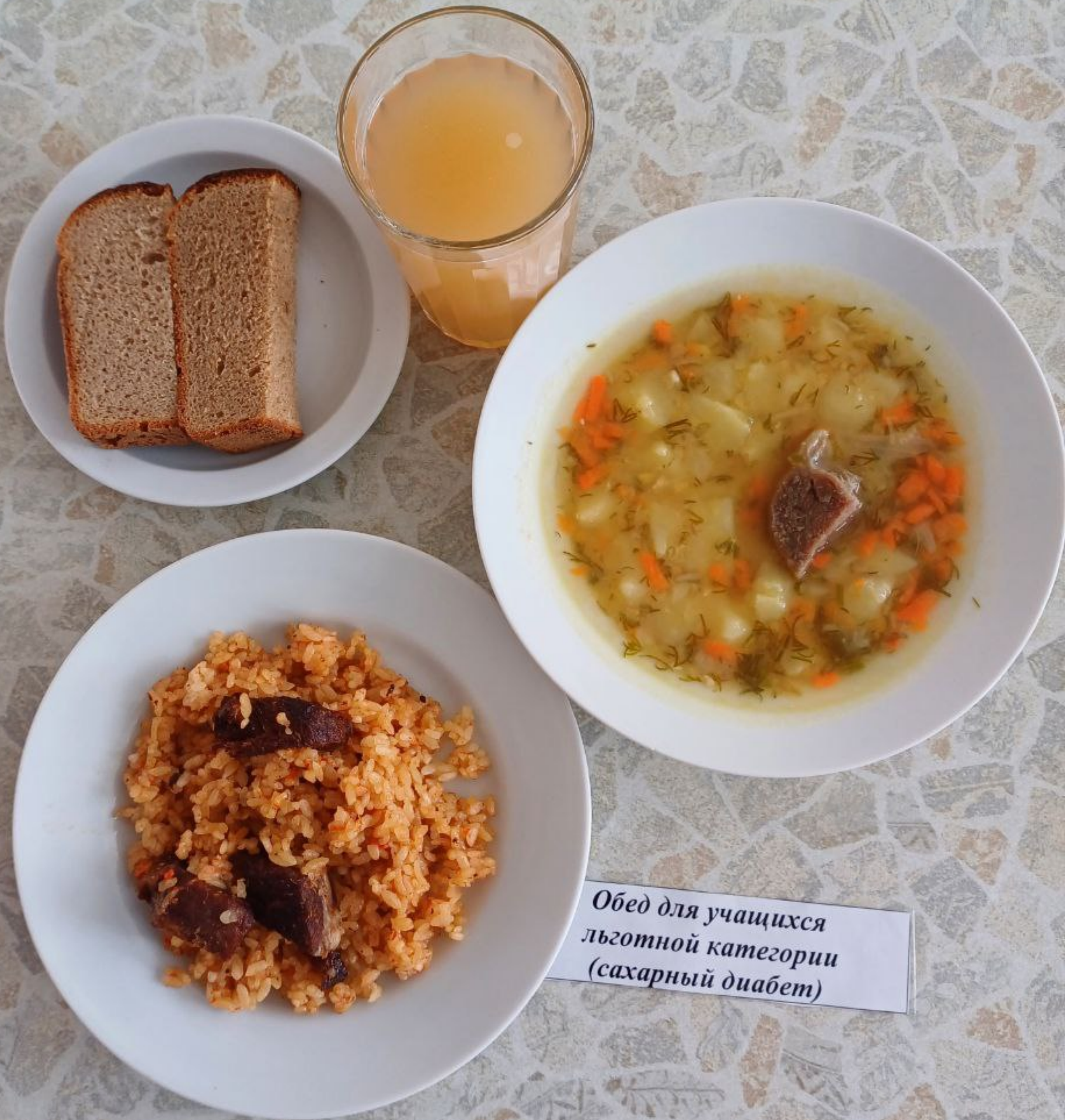
Обед для учащихся льготной категории (сахарный диабет)