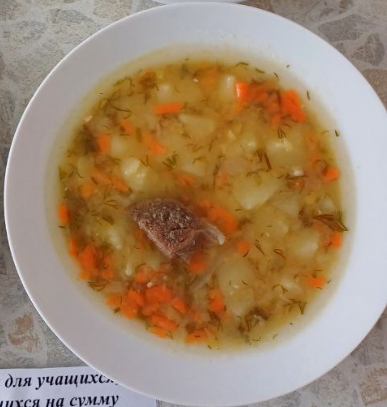
Полдник для учащихся, питающихся на сумму дотационных выплат 1 – 4 классы (2 смена)