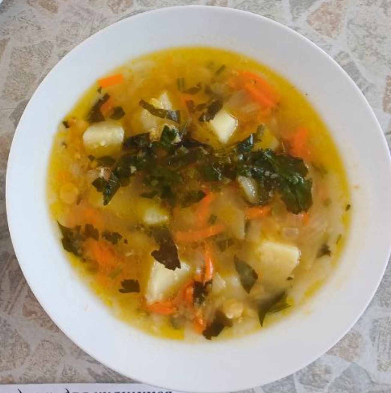
Полдник для учащихся, питающихся за родительскую плату 5-11 классы