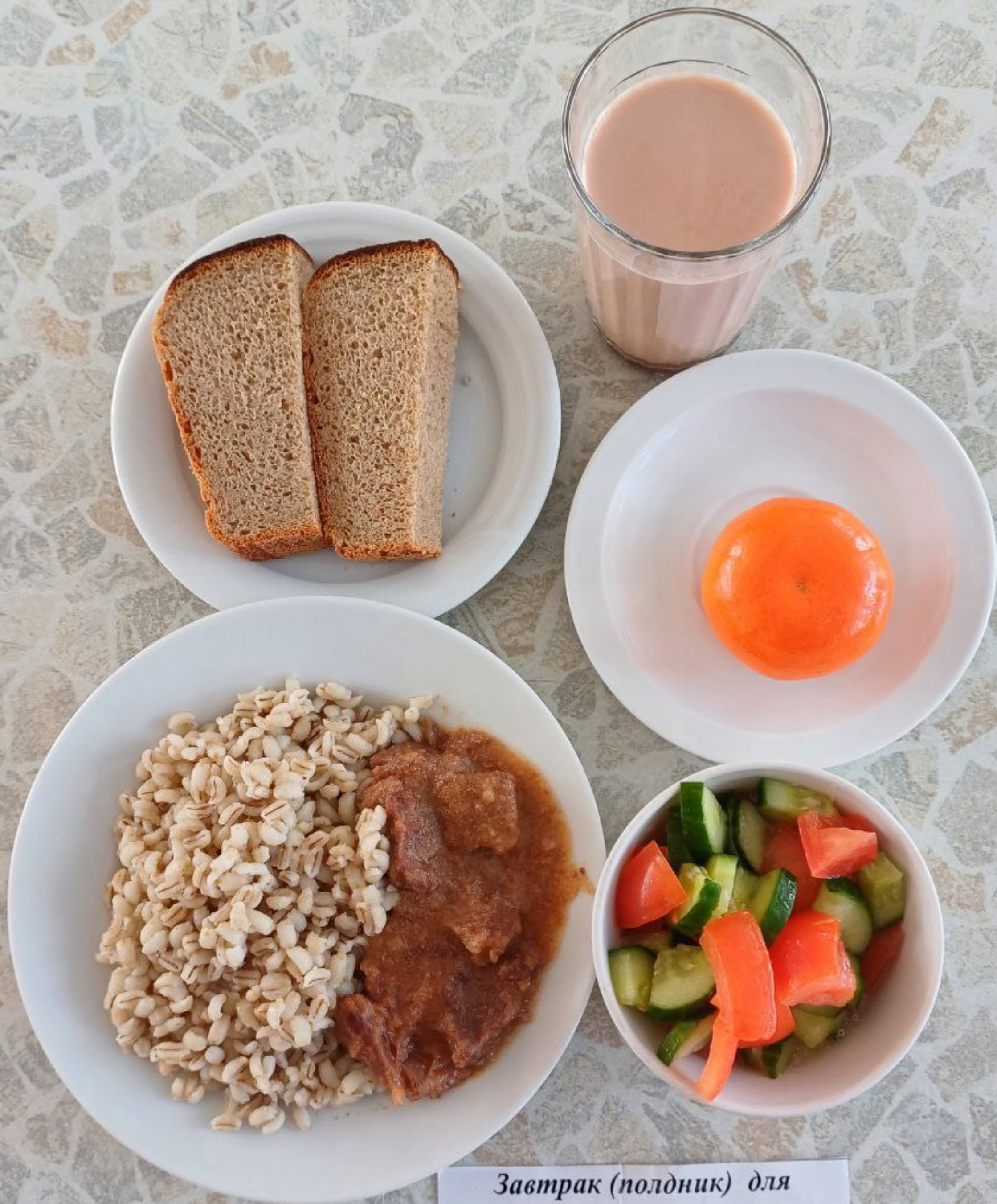
Завтрак (полдник) для учащихся льготной категории (сахарный диабет)