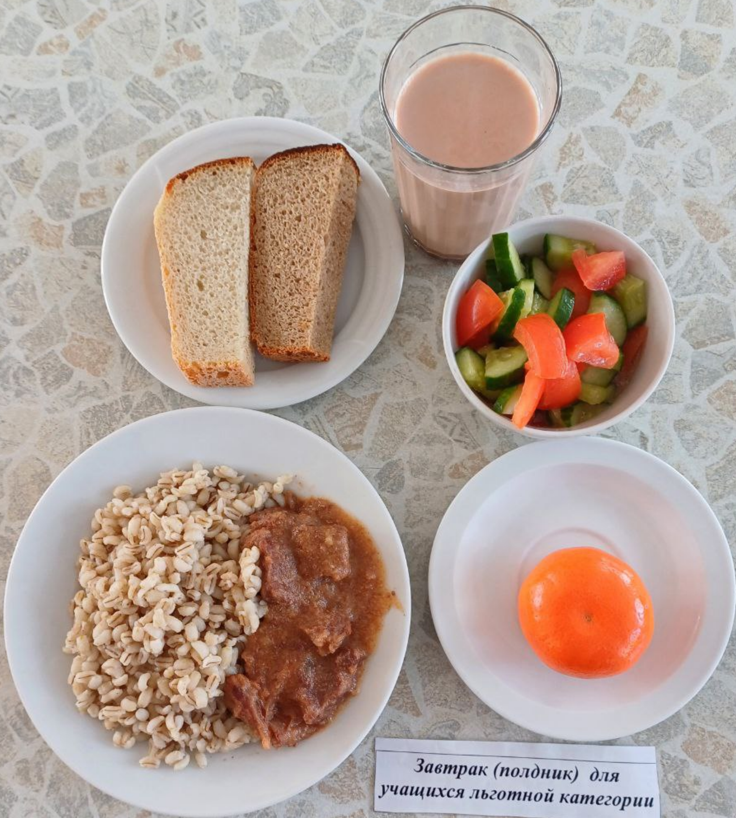
Завтрак (полдник) для учащихся льготной категории