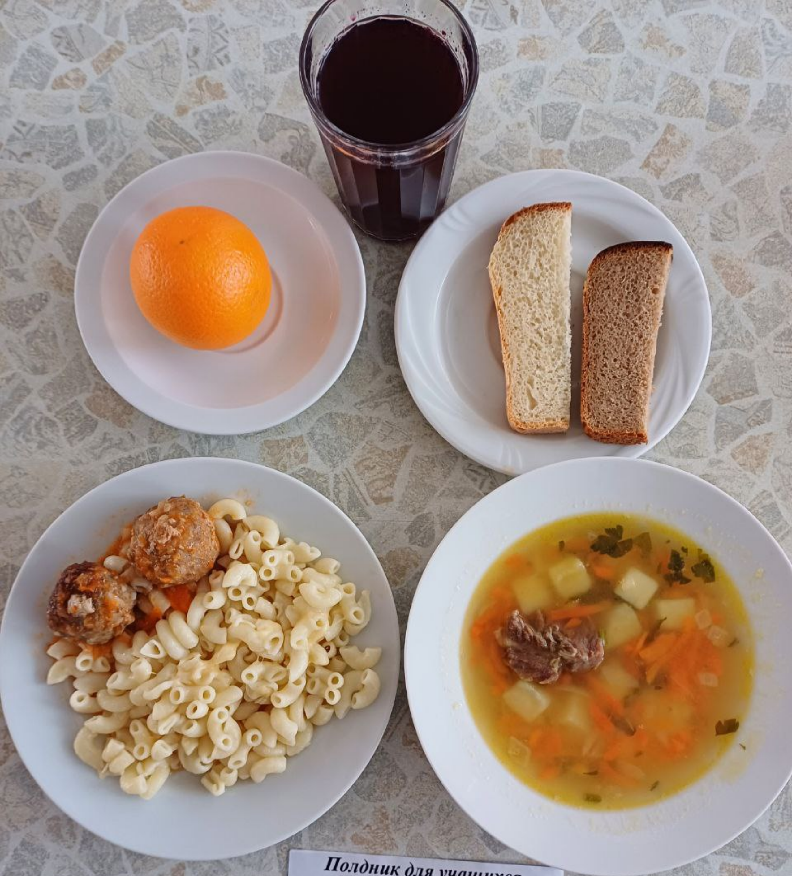
Полдник для учащихся, питающихся на сумму дотационных выплат 1 – 4 классы (2 смена)