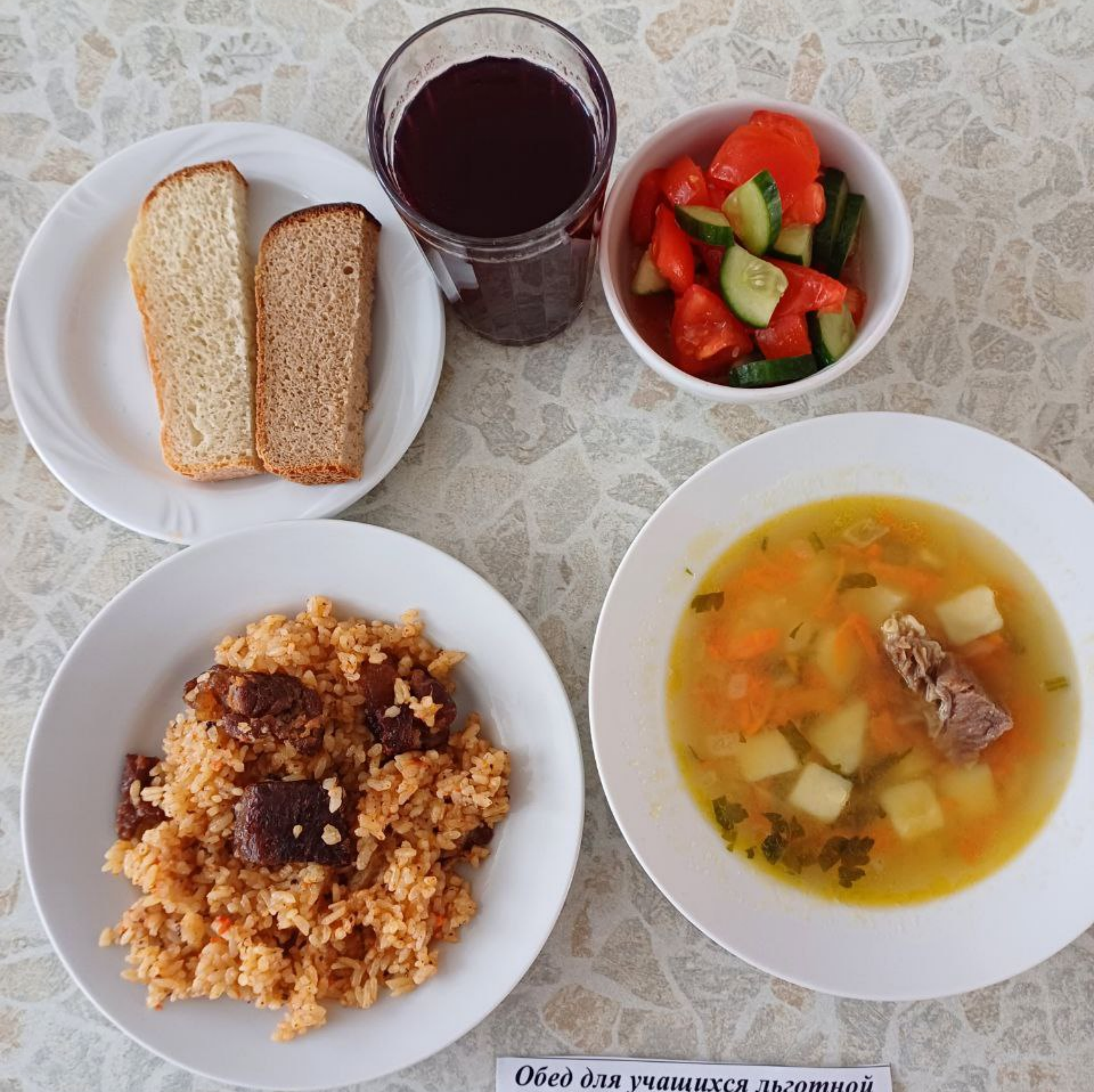
Обед для учащихся льготной категории