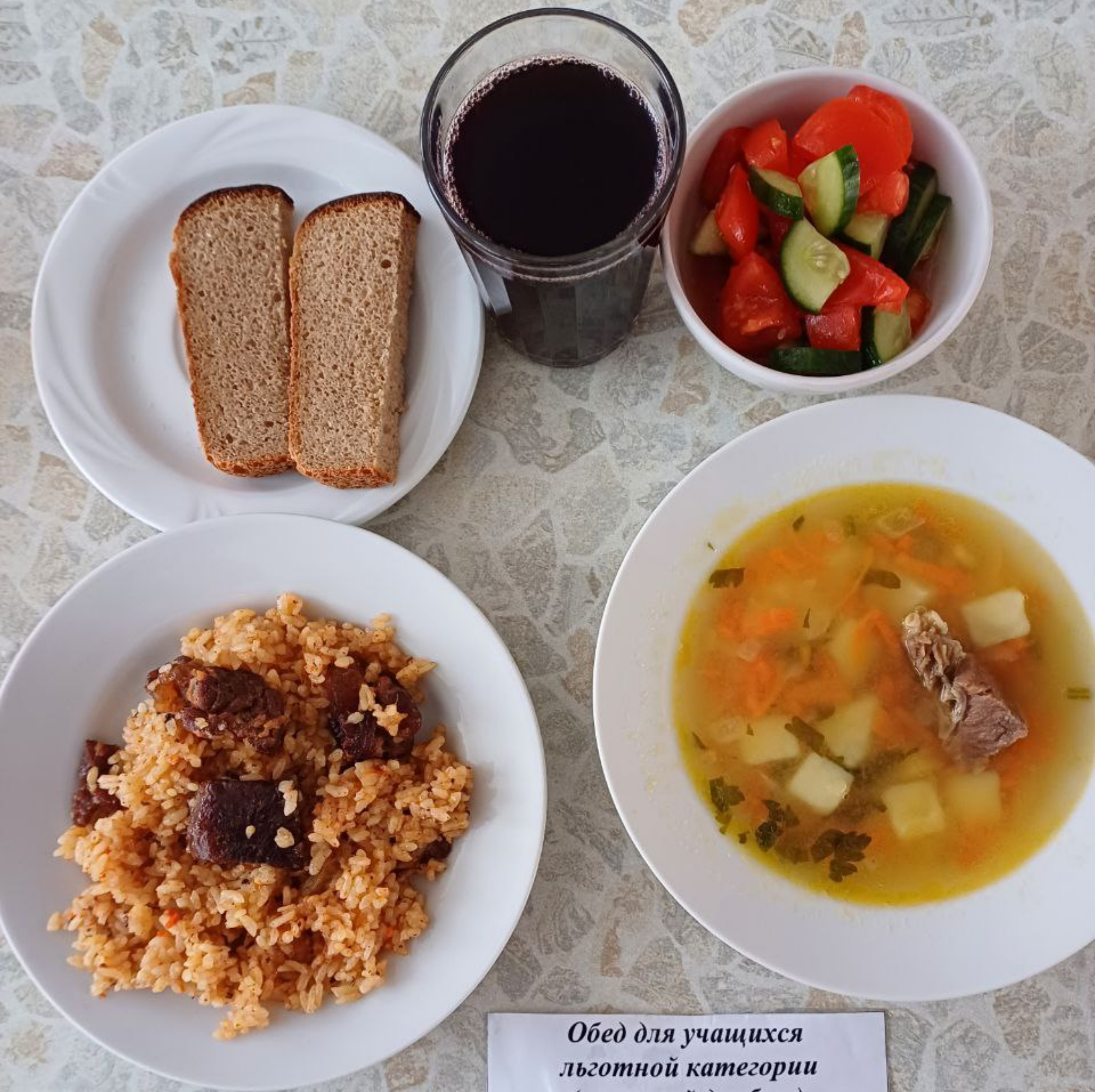
Обед для учащихся льготной категории (сахарный диабет)