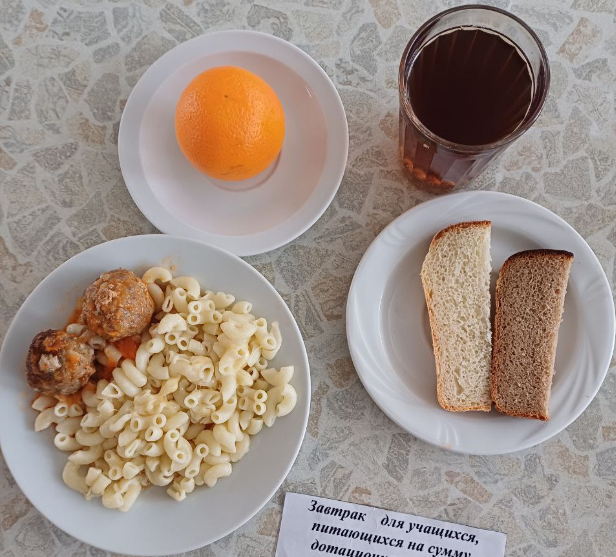
Завтрак для учащихся, питающихся на сумму дотационных выплат 1 – 4 классы (1 смена)