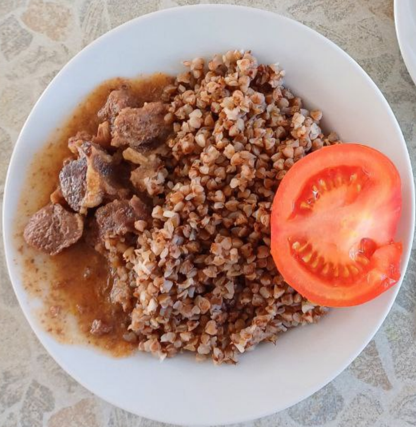
Завтрак для учащихся, питающихся за родительскую плату 5-11 классы