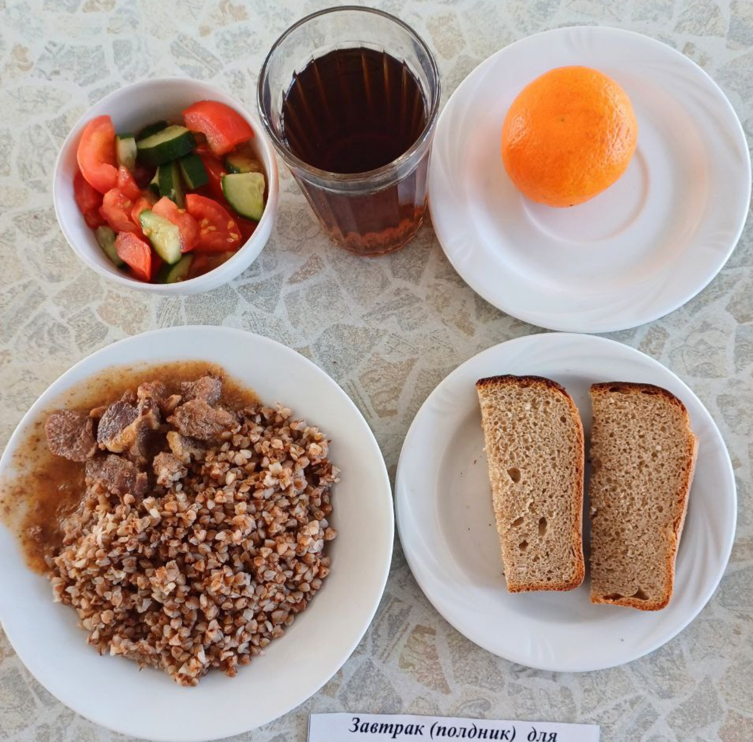
Завтрак (полдник) для учащихся льготной категории (сахарный диабет)