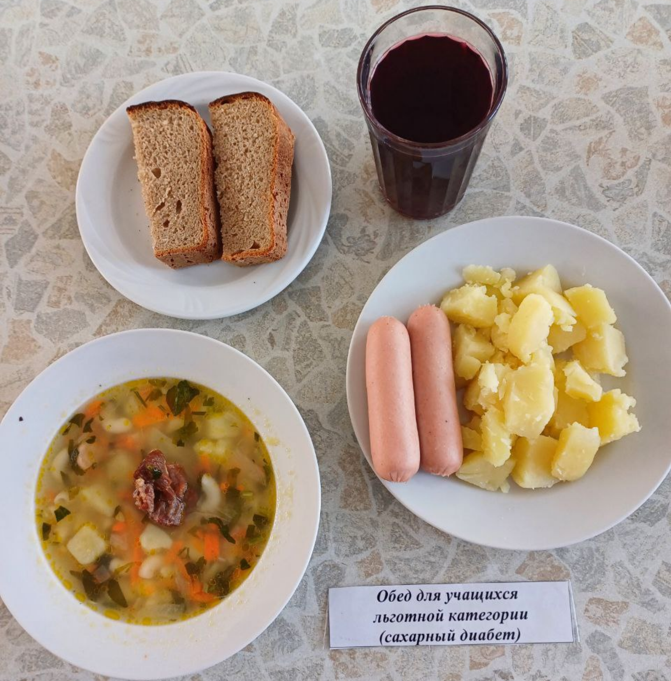
Обед для учащихся льготной категории (сахарный диабет)