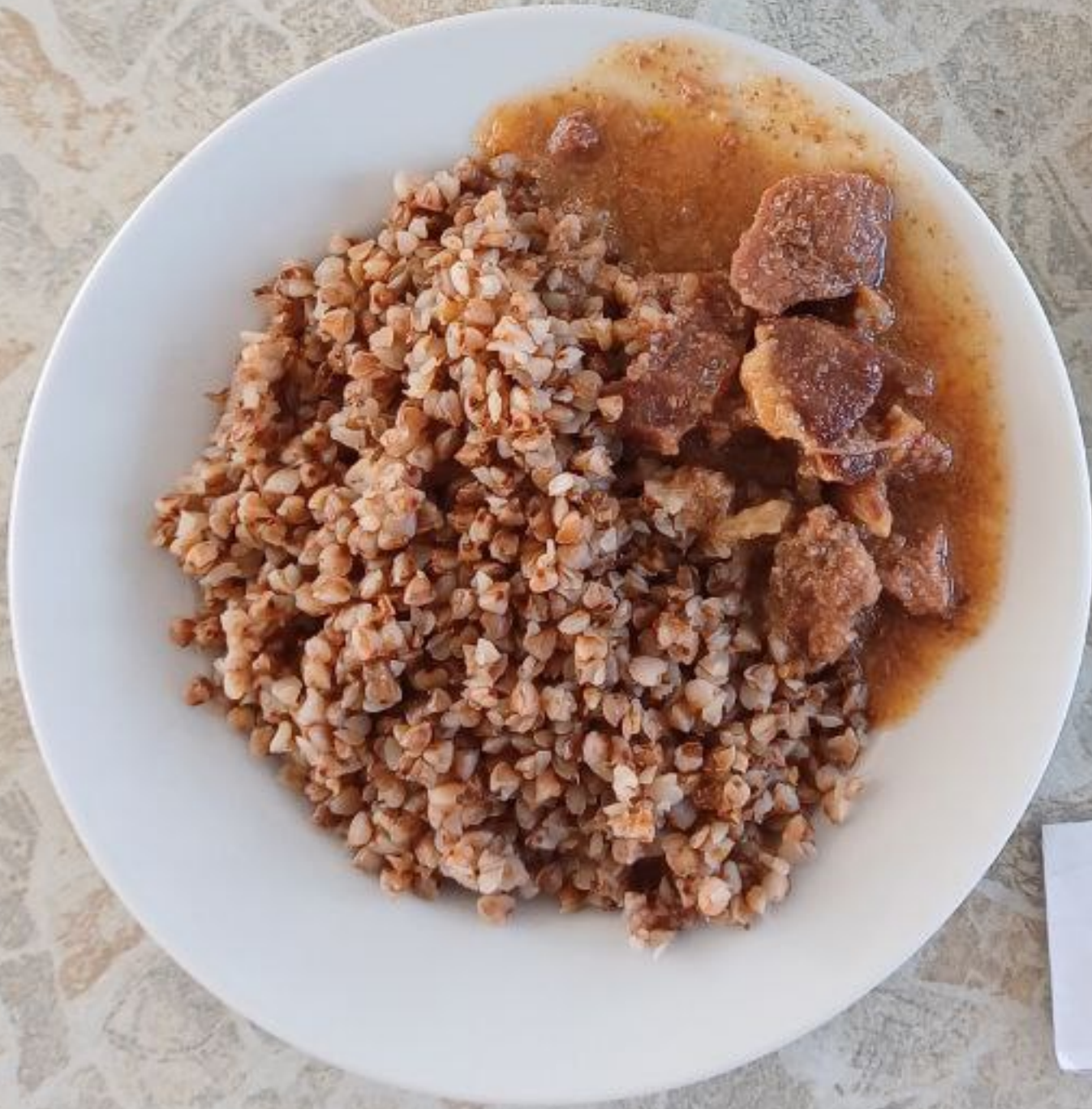
Завтрак для учащихся, питающихся на сумму дотационных выплат 1 – 4 классы (1 смена)