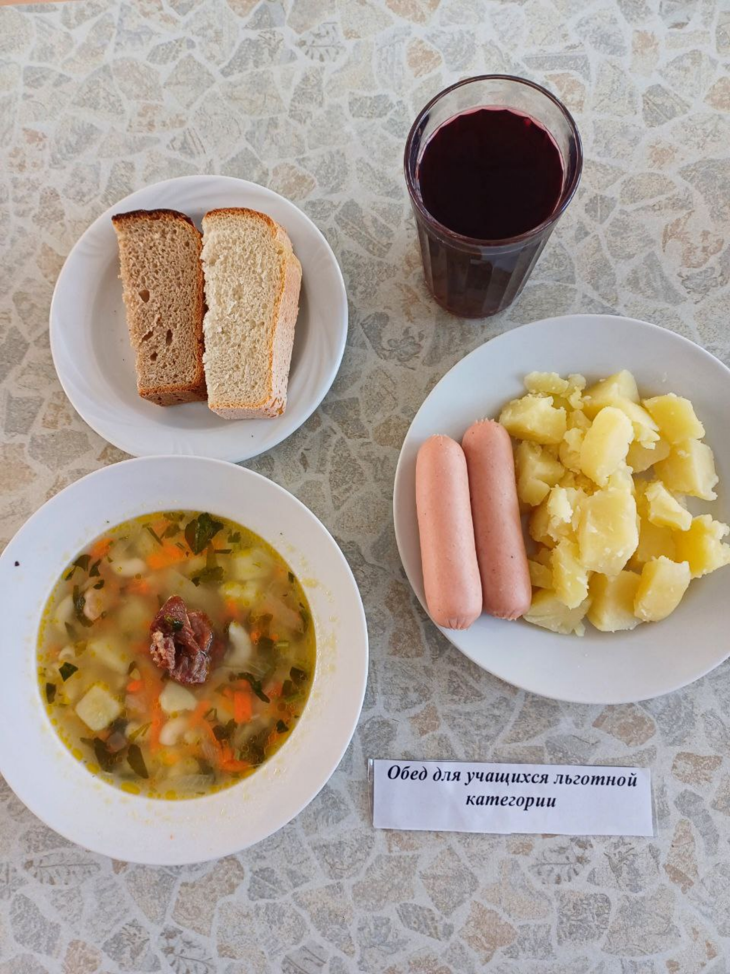
Обед для учащихся льготной категории