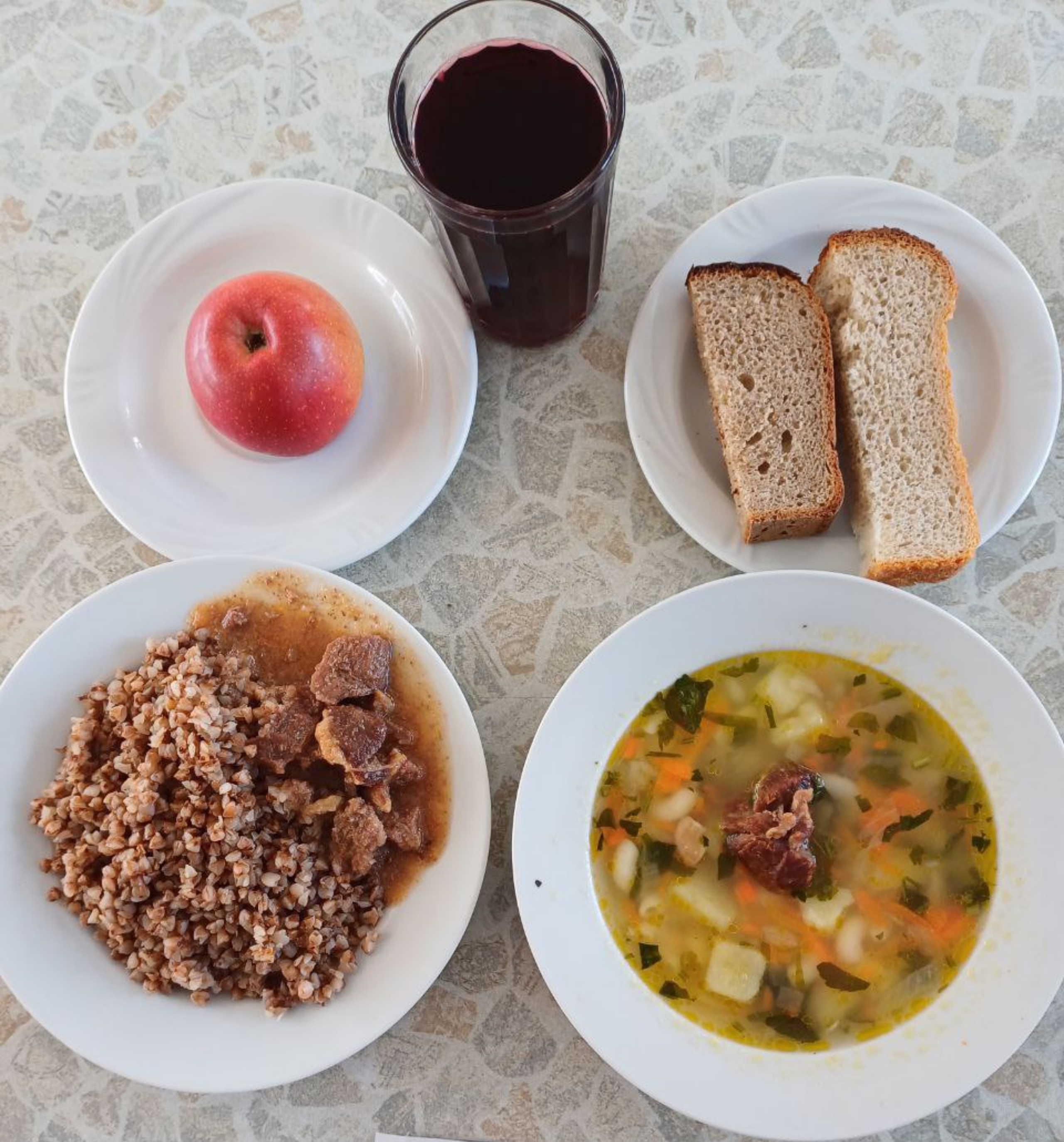
Полдник для учащихся, питающихся на сумму дотационных выплат 1 – 4 классы (2 смена)