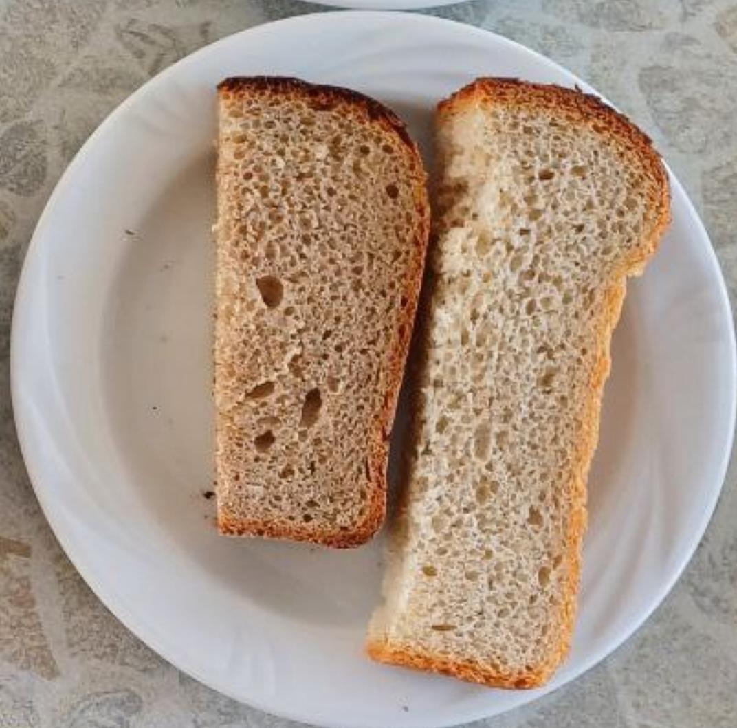
Завтрак (полдник) для учащихся льготной категории