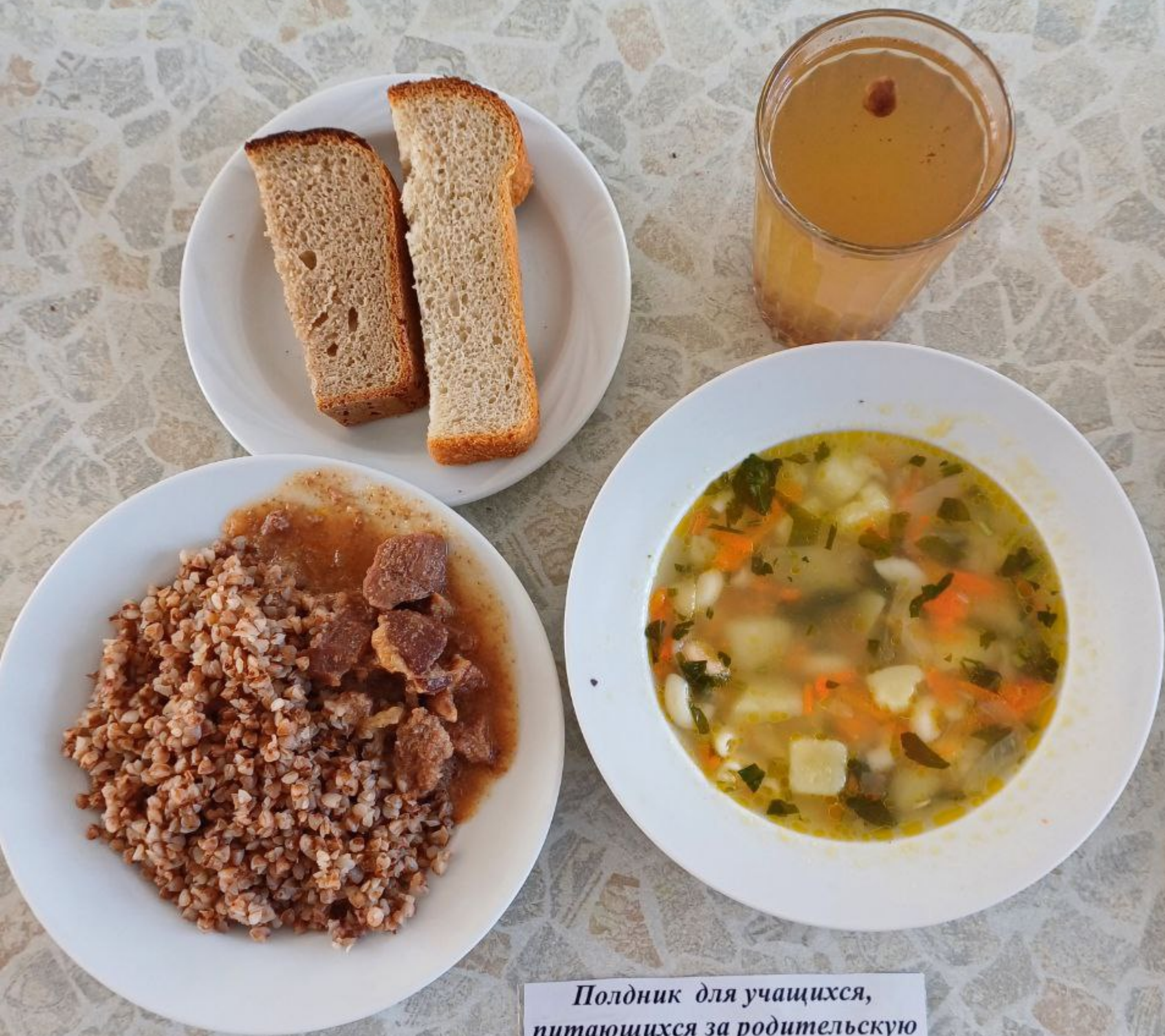
Полдник для учащихся, питающихся за родительскую плату 5-11 классы